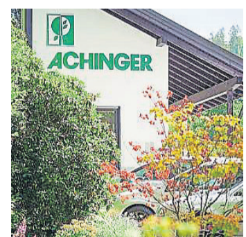
Die Firma Gärten und Freiräume GmbH, wurde 1958 in Bad Berleburg gegründet und ist seit 1966 anerkannter Ausbildungsbetrieb.

feiern Feste - nicht nur auf dem Betriebshof und sind stolz auf eine sehr geringe Fluktuation und gute Belegschaftsstruktur mit engagierten Azubis und Facharbeitern, die den Betrieb voranbringen. Gemäß der Maxime, daß der Garten Ausgleich und Ruheoase für die Kunden darstellt, geben beide das mit der Planung verbundene Flair rund um das Thema Pflanze an die Mitarbeiter und Azubis weiter und achten auf eine handwerklich gute Umsetzung der Planungsabsichten.